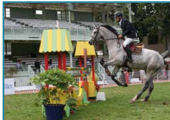
la filière équine

que notre territoire est trop isolé, mal desservi, loin de la capitale ou de Lyon. Le Pays Vichy-Auvergne sert de territoire d'expérimentation dans l'Allier en matière de politique d'accueil et l'arrivée d'une gare nouvelle sur le territoire pourrait transformer cet essai pour créer une véritable dynamique.